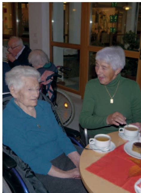
gemütliches Beisammensein bei Kaffee und Kuchen im An- schluss an die Gedenkmesse

Verstorbene sind weiterhin mit uns Beten und hoffen mit uns Bringen uns die Kraft der Ewigkeit mitten in unseren Alltag. Verstorbene Gehören weiterhin zu unserem Kreis Geheimnisvoll nah Leben sie in uns weiter Als liebende Kraft Verstorbene Bewegen uns weiterhin zum Frieden Unsichtbar – gegenwärtig In der Kraft des Gebetes Das ermutigt zum achtsamen Dasein Einfach anders Sind sie kraftvoll da.